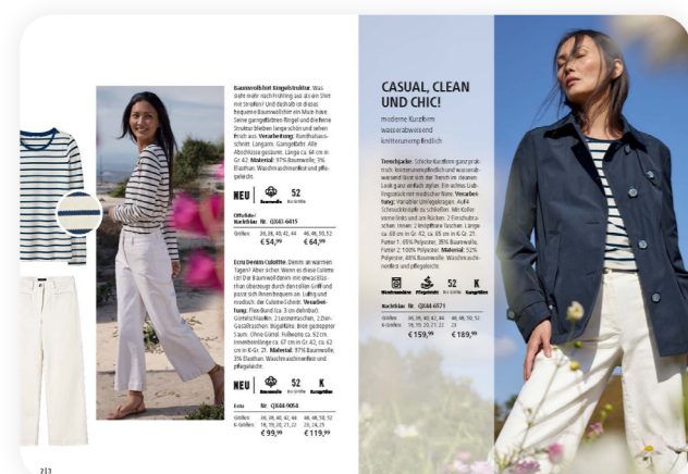
Doppelseiten erfolgreicher Kataloge.

Für die optimale Produktdarstellung werden spezielle Templates eingesetzt. Durch diese ist es gelungen, manuelle Arbeiten auf ein Minimum zu reduzieren.